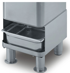
Штатив с дополнительным фильтром